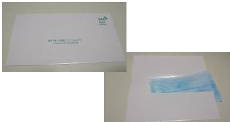
紙製マスクケース