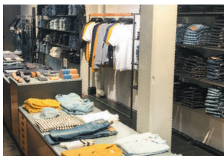
デニム以外にTシャツなどもある（Tシャツもオーガニックコットンのみで製造）