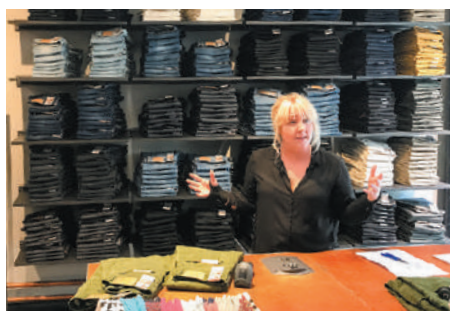
Nudie Jeansの店内。こだわりのデニムが並ぶ

容器包装資材の販売、セールスプロモーション事業などの展開を行う中で、サステナビリティを経営のベースとし、経営革新とイノベーションに取り組む。北欧スウェーデンを中心に、サステナブルな仕組み、モデル、商品開発、行政、教育機関、都市計画をベンチマークし、自社の経営に取り入れる。